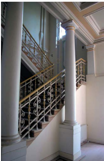
Innenausbau des Palmengartens

Die Stadt Frankfurt a. M. ließ das Gesellschaftshaus des Palmengartens um- und teilweise neu bauen. Die gesamte Maßnahme wurde während des laufenden Betriebes des Palmengartens sowie des Palmenhauses durchgeführt. Mit der Sanierung wird der historische Festsaal von 1879/1890 wieder zu einem belebten Mittelpunkt der Frankfurter Fest- und Veranstaltungskultur.